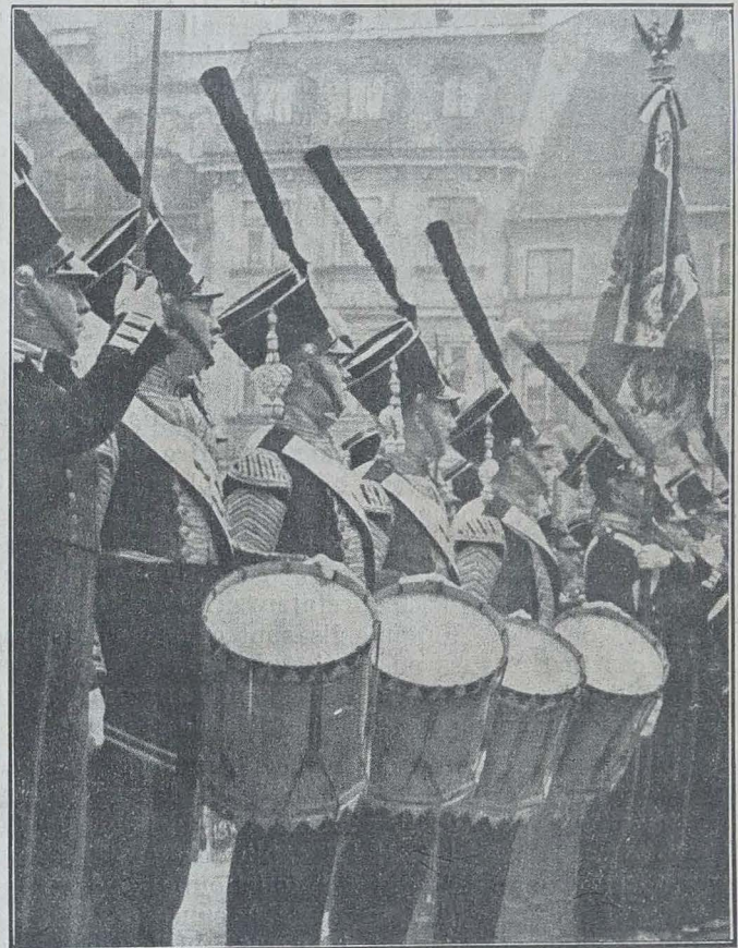
A VARSOVIE, EN NOVEMBRE L'INSURRECTION DE 1831 CONTRE LES OPPRESSEURS RUSSES EST COMMÉMORÉE AVEC LES UNIFORMES DE L'ÉPOQUE