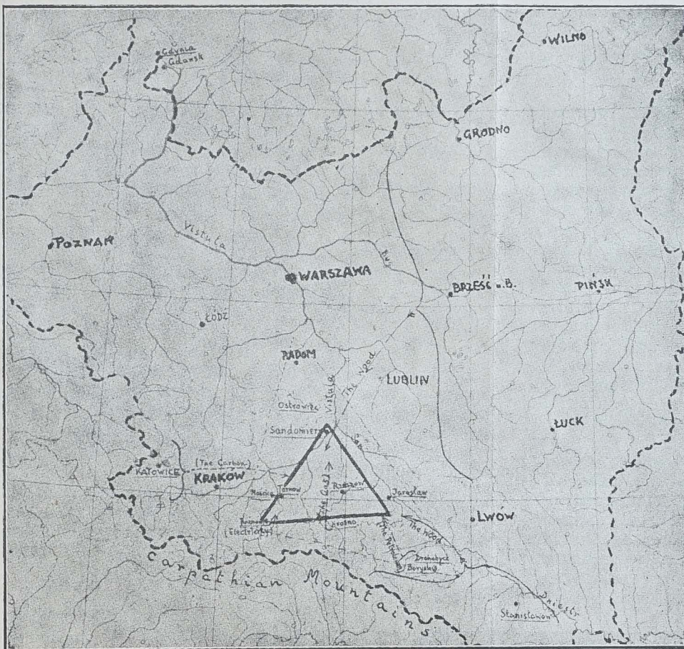
CARTE de la NOUVELLE RÉGION INDUSTRIELLE

La Pologne fait un gros effort pour établir dans sa région centrale, non loin des mines de houille et des puits de pétrole qui produisent aussi le gaz de terre, une région industrielle qui sera des plus importantes. Les usines, et même les villes s'y construisent avec une stupéfiante rapidité, en particulier autour de Sandomierz. Cette région est indiquée sur la carte par le rectangle.