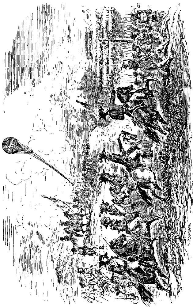
La bataille de Fleurus.