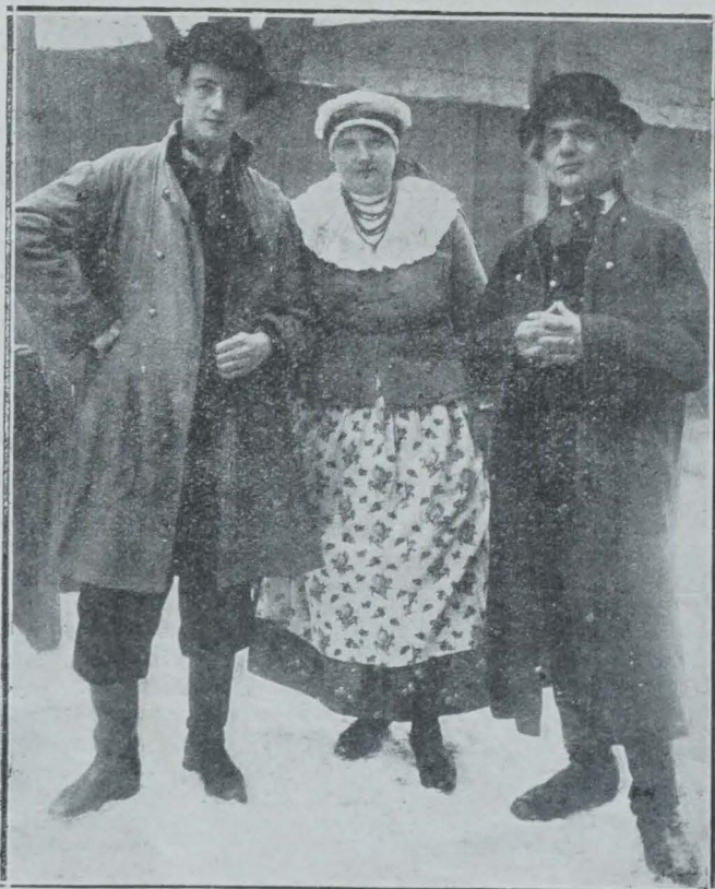
LES « SWATY »

Un jeune homme, avant de se marier, envoie chez les parents de la jeune fille deux paysans, les « swaty », choisis parmi les plus considérés du village, pour leur annoncer ses projets. Ce sont des gens d'une grande éloquence, surtout lorsqu'ils ont bu un verre de wodka. La jeune fille est bien contente, puisqu'il s'agit de son mariage, mais elle fait semblant d'être effrayée et se cache dans l'alcôve. Les « swaty » parlent alors avec les parents. Ils leur dépeignent le jeune homme en soulignant les beaux traits de son caractère et ils