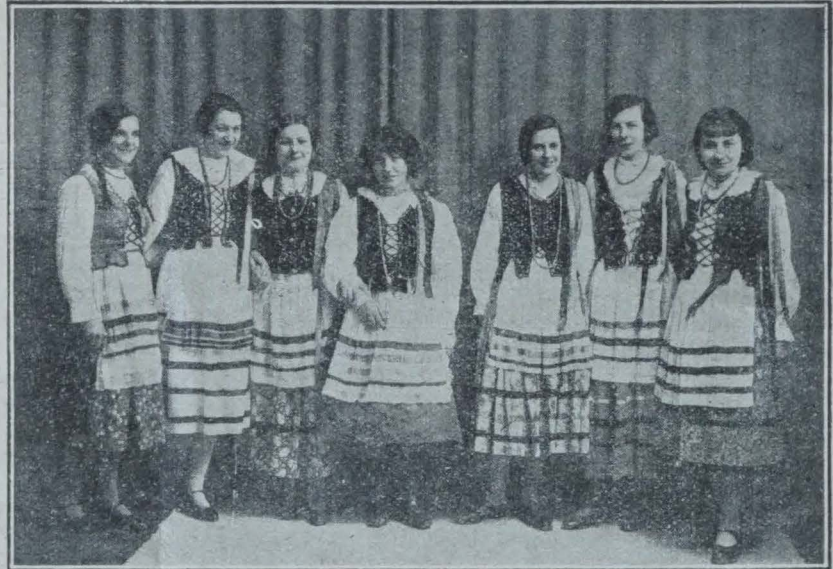
LES COLLÉGIENNES DE SOISSONS EN CRACOVIENNES

Chers amis, si l'un de vous reçoit plusieurs réponses et ne choisit qu'un correspondant, qu'il ait la courtoisie de prévenir les autres par une carte postale de regrets.