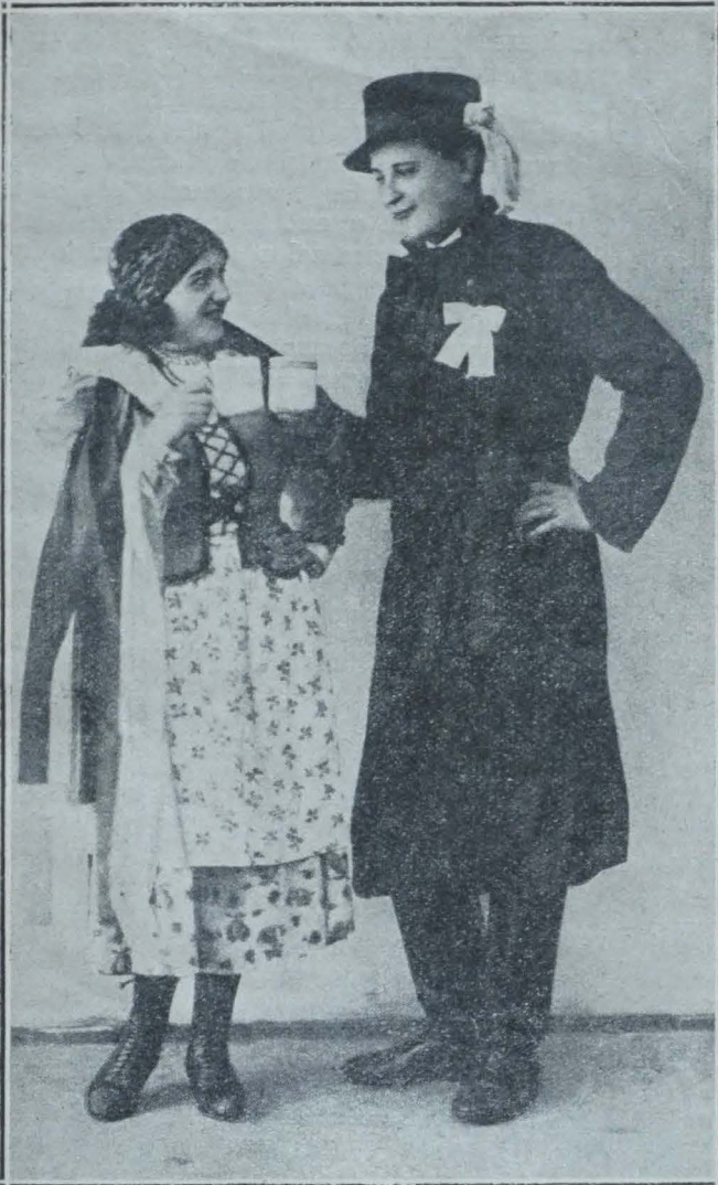
LE FIANCÉ ET LA FIANCÉE

s'entendent sur la dot de la jeune fille. Ils ont apporté de l'eau-de-vie avec eux et, si les parents consentent à donner leur fille à leur protégé, ils boivent ensemble à la santé du jeune couple. Le jeune homme qui attendait le résultat dehors avant d'entrer, paraît alors. On appelle la jeune fille, en lui annonçant la décision de ses parents. Le jeune homme verse de l'eau-de-vie dans une coupe symbolique et l'offre à sa fiancée. Et voilà que la chambre s'emplit de voisins et de voisines, vieux