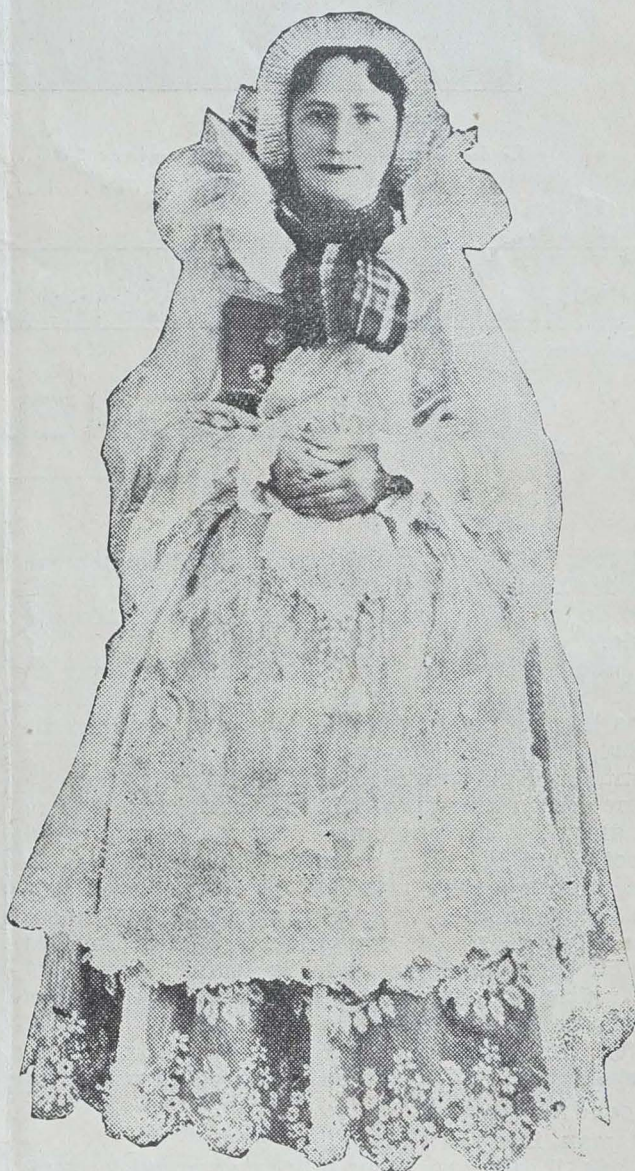
UNE PAYSANNE DE ŻYWIEC (Beskides polonaises) DANS SON AÉRIEN COSTUME DE DENTELLE