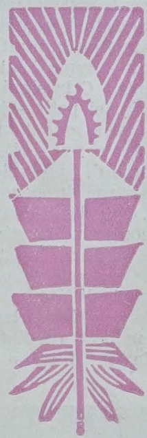
CRÛCHE DE NOËL