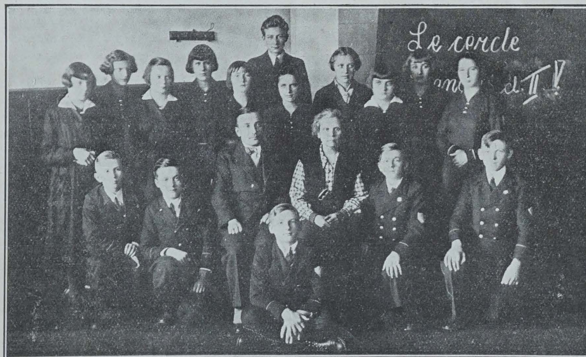
LE CERCLE FRANÇAIS AU LYCÉE MIXTE DE WAGROWIEC

Chers amis polonais, je vous indique que le bureau des Chemins de fer Français, rue Ossolinskich, 4 à Varsovie, tient toujours à votre disposition, pour orner vos salles de lecture, de très belles affiches françaises, qu'il vous donnera gracieusement. Il vient aussi d'éditer en polonais un magnifique album illustré sur les stations thermales françaises « Zdrojowiska Francuskie ». Demandez-le lui donc de notre part !