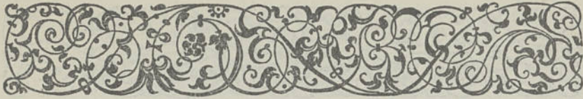
TABLE DES DIVISIONS