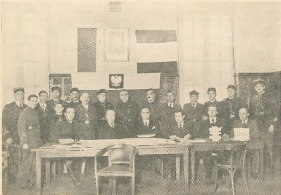
Jedna z komisji poborowych w północnej Francji.

Nikt nie był chory, nikt nie starał się zwolnić ze swego obowiązku. Widziało się rodaków, którzy przeszli wojnę w 1914, kilkakrotnie ranionych, u-