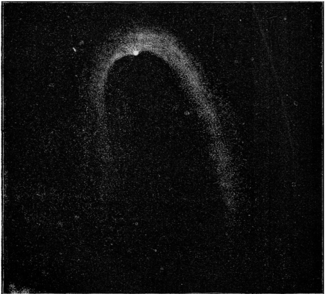
COMÈTE DE COGGIA vue au télescope le 13 juillet 1874.