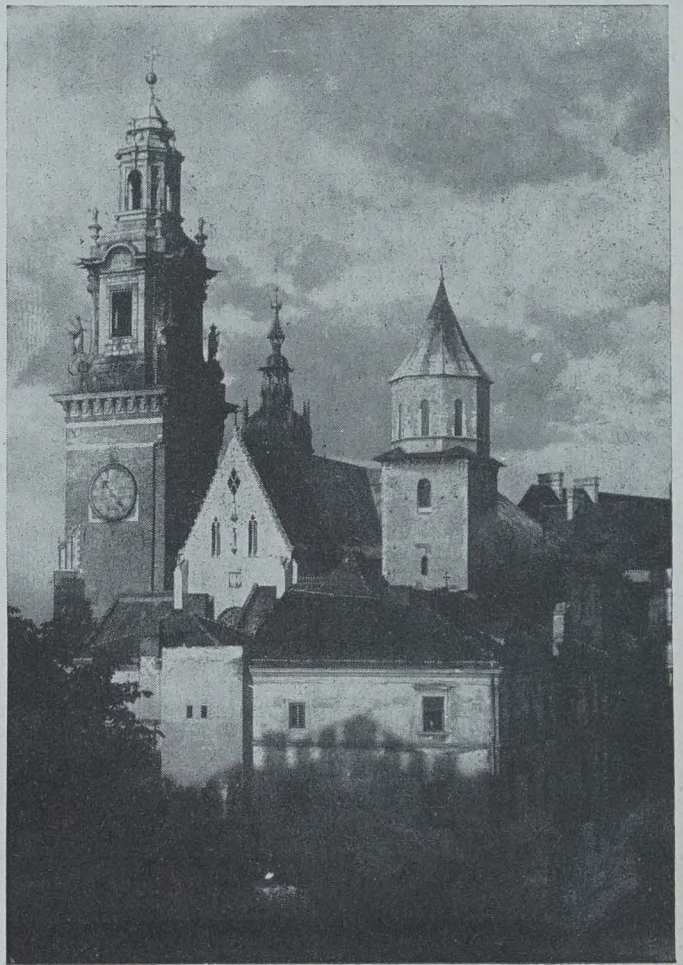
LE WAWEL DE CRACOVIE

Quant à Messire Twardowski, il ne voyait plus rien ; il chantait toujours, en l'honneur de la Vierge, son dernier refuge. Il ne sentit même pas qu'à ce chant sacré le démon ralentissait sa course, et que, peu à peu, tout doucement, il se dégageait de son fardeau. Mais, quand la dernière strophe fut achevée, Messire Twardowski s'aperçut, tout à coup, qu'il était immobile au milieu du ciel. Il regarda autour de lui, et resta pétrifié d'étonnement : son camarade Satan avait dis-