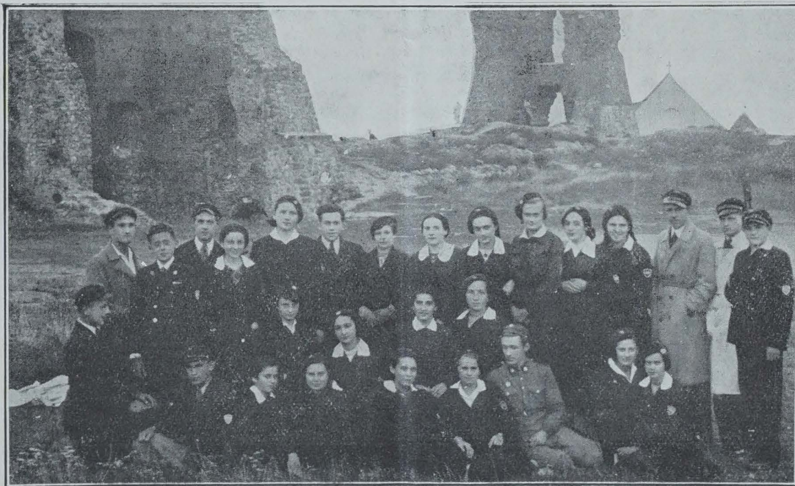
LE CERCLE DES AMIS DE LA FRANCE AU LYCÉE ADAM MICKIEWICZ A NOWOGRODEK