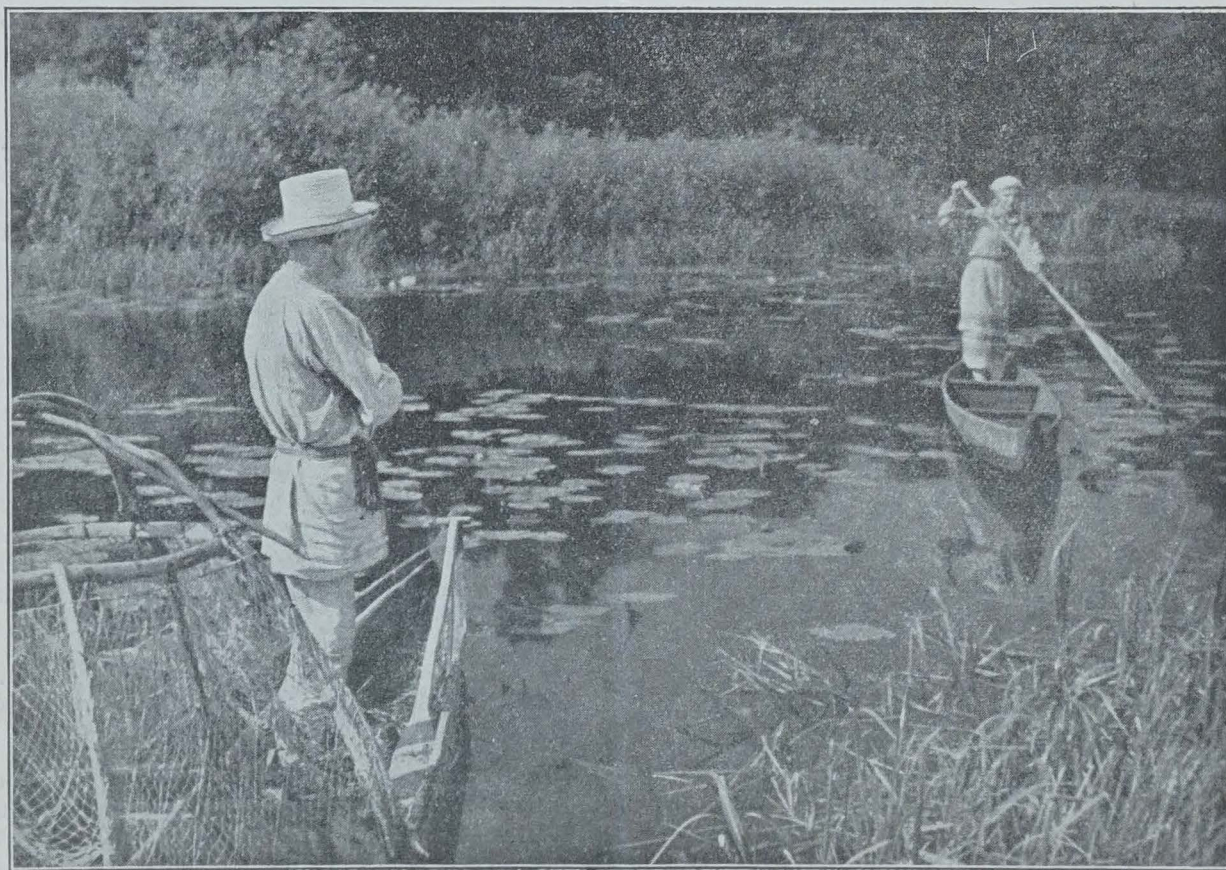
PÊCHEURS EN POLÉSIE