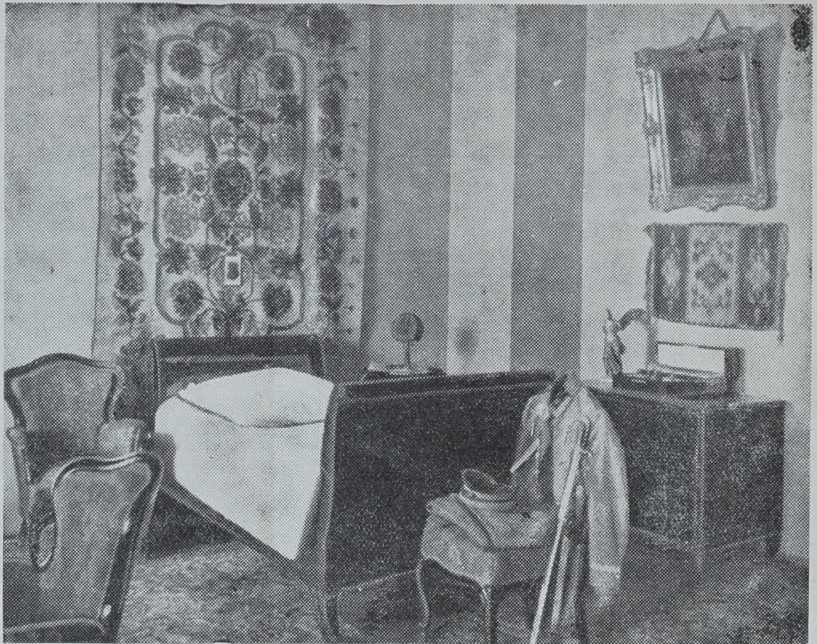
LA CHAMBRE DU MARÉCHAL

Maintenant que le grand Maréchal Joseph Pilsudski repose avec les rois de Pologne dans la cathédrale du Wawel à Varsovie, le palais du Belvédère à Varsovie, où il a vécu et travaillé, sera transformé en Musée.