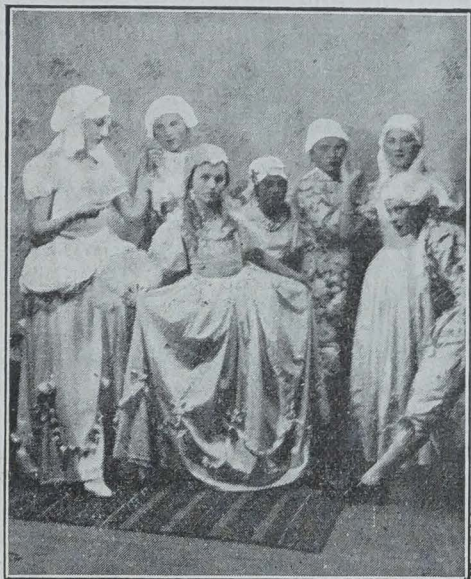
AU LYCÉE DE HRUBIESZOW