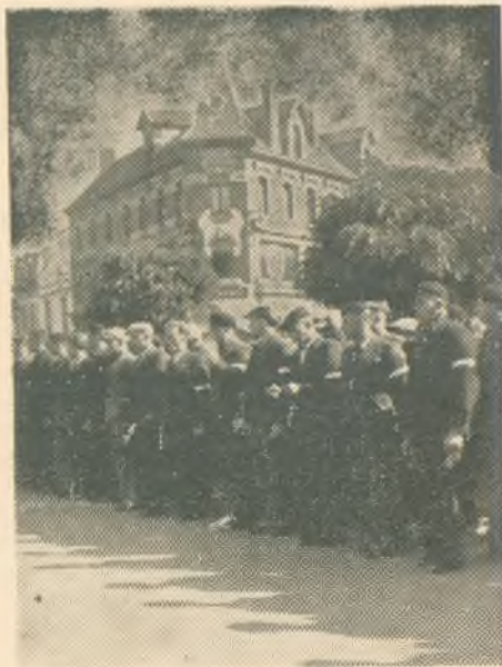
Młodzi wychodźcy polscy, jedni z pierwszych, którzy powołani zostali do służby w Armii Polskiej.

Żegnali ich przedstawiciele Konsulatu Generalnego R. P. w Lille, Zarząd Polskiego Centralnego Komitetu Obywatelskiego, rodziny oraz liczne grupy