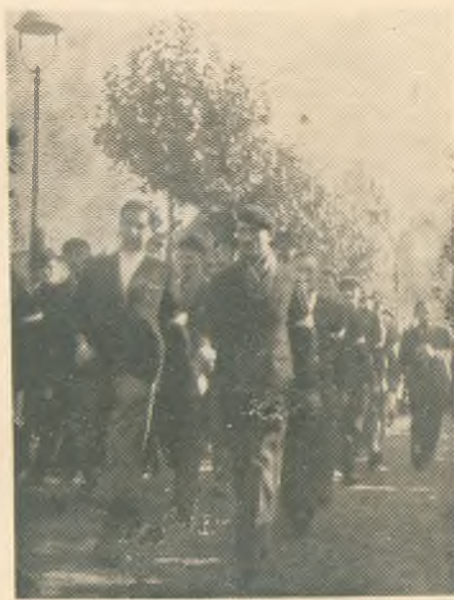
Ochotnicy polscy, przed wyjazdem do obozu ćwiczebnego, udając się do pomnika poległych w Lens (P. de C.)

każdy Polak we Francji złożył na ten cel conajmniej 1-dniowy zarobek w miesiącu.