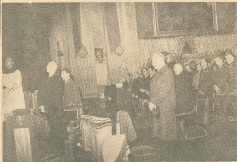
Prezydent i nowy Rząd Rzplitej w kościele polskim w Paryżu.

Wierzę niezłomnie, że w tej walce o najwyższe dobra moralne ludzkości, Bóg Wszechmogący zniweczy zło i pozwoli zatryumfować dobru, by dokonało się posłannictwo naszego narodu.