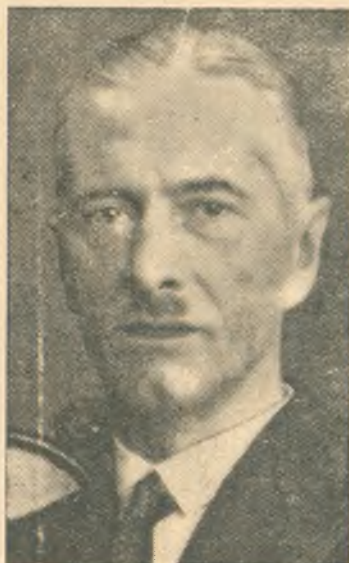
Władysław RACZKIEWICZ Prezydent Rzeczypospolitej Polskiej

Stając w szeregu spadkobierców majestatu odro-