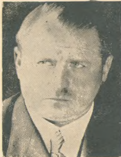
Prezydent m. Warszawy mjr. STARZYŃSKI

nieśmiertelną, wielką i zwycięską Polskę, Waszym bohaterstwem postanowiliśmy dla nas i całego cywilizowane-