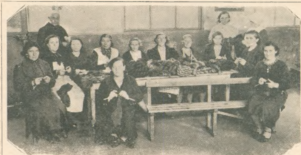
Te po całych dniach migocą pracowicie drutami, robiąc ciepłe swetry i rękawice dla nieznanym — a tak sercu bliskich! — żołnierzyków... (Sekcja Kobiet w Barlin (Pas de Calais) przy pracy).

A te inne kobiety i młode dziewczęta, układane i zuchwałe, przebiegłością, niewieścią i rewolwerem w drobnej dłoni torując sobie drogę do najbar-