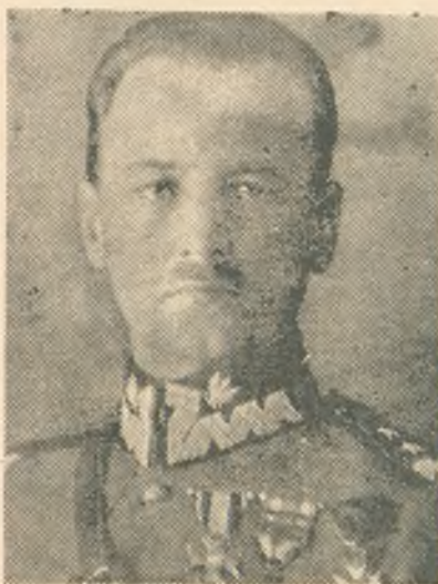
Generał SIKORSKI Prezes Rady Ministrów.

W tej dziejowej dla Narodu chwili, jedynie czyny a nie słowa mają znaczenie. Dlatego, powodowany twardym obowiązkiem żołnierskim podejmuję działanie. W pełnym porozumieniu z panem Prezydentem Rzeczypospolitej i za Jego wolą, stanąłem na czele Rządu jedności narodowej i objąłem naczelne dowództwo podlegających Mu sił zbrojnych. W momencie tym ślubuję T o b i e , Narodzie polski oraz Cieniom Poległych Obronców Ojczyzny i Wolności, jak i bohaterom W a r s z a w y , Modlina , Westerplatte i Helu a wreszcie wszystkim Nieznanym Żołnierzom Rzeczypospolitej, którzy spełnili swój najświętszy wobec Polski obowiązek, że i ja go